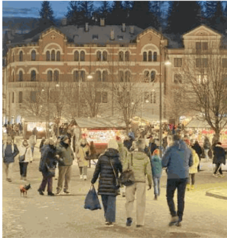
Fioccano gli arrivi Si va verso il pienone delle festività