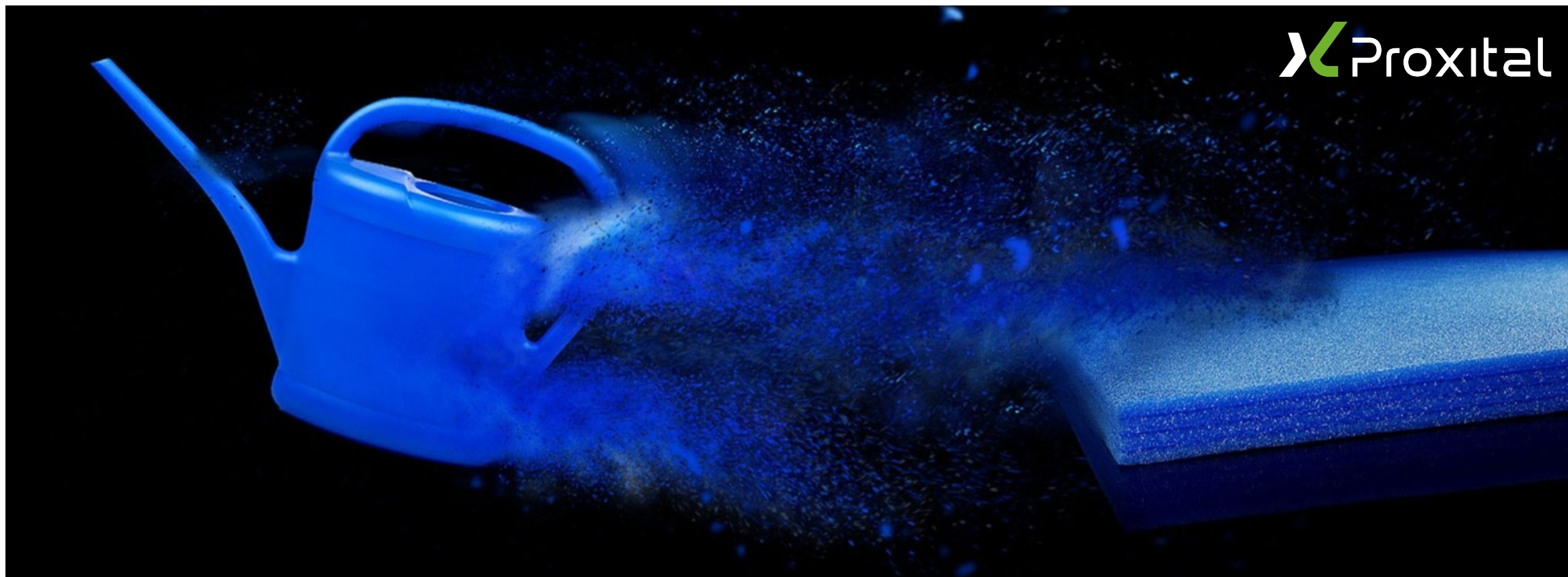
Immagine rappresentativa progetto